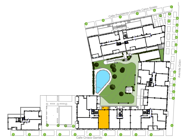
PORTAL 5 PLANTA TERCERA VIVIENDA D