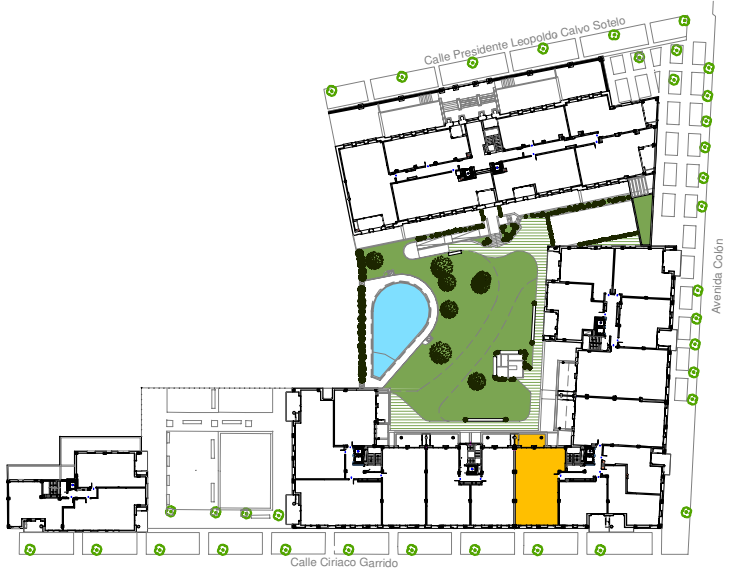
PORTAL 3 PLANTA SEGUNDA VIVIENDA A